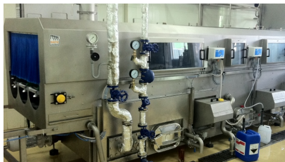
DIONA 600 JSC „Obolon”, Kiev, Ukrajina